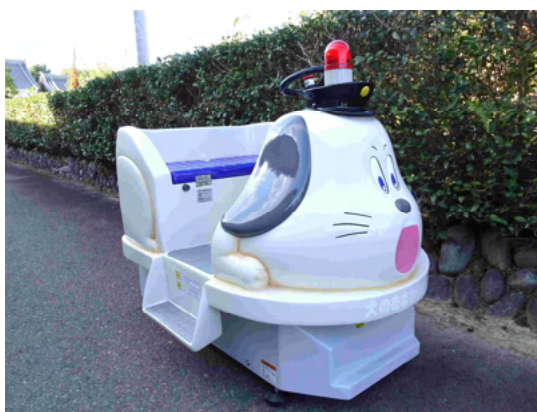
A2-032 バッテリー式定置乗物 どうぶつシリーズ