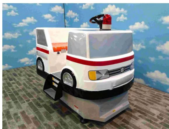
A2-032 バッテリー式定置乗物 働く車シリーズ