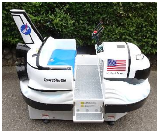
ひこうきくん・シャトルくん