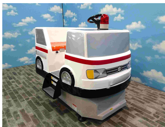
A2-032 バッテリー式定置乗物 働く車シリーズ